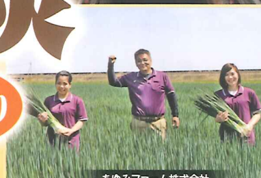
あゆみファーム株式会社