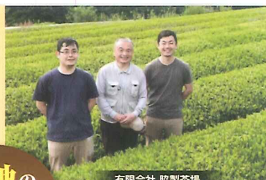
有限会社 監製茶場