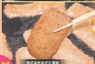
株式会社おがた蒲鉾