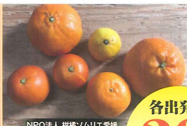
NPO法人 柑橘ソムリエ愛媛

農産地や生産者の方と 直接ふれあい 愛媛県産農産物の魅力を 直に感じてもらえる 産地商談バスツアーで 産地のお土産付です。 是非ご参加ください!