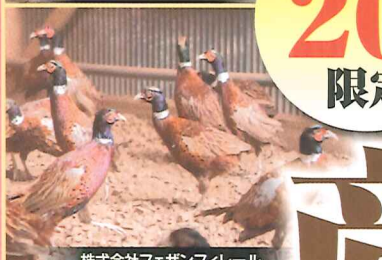
株式会社フェザンフィレール