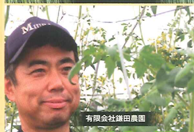
有限会社鎌田農園